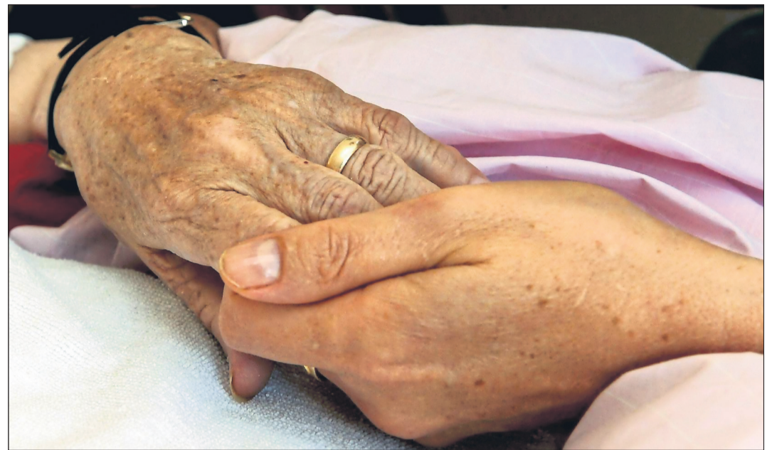
Schmerzmanagement bis Krisenintervention: Das Palliativ Care Team unterstützt Menschen in ihrer letzten Lebensphase.