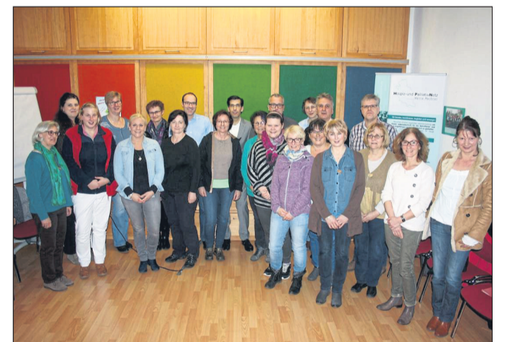
Sie beraten über die Unterstützung für Sterbende und Schwerst- kranke: die Fallkonferenz des Hospiz- und Palliativnetzes.

Die Voraussetzung für den Betroffenen sind, dass er an einer unheilbaren, lebenslimitierenden, fortschreitenden beziehungsweise bereits weit fortgeschrittenen Erkrankung leidet, deren Symptome eine spezielle palliativmedizinische Versorgung erfordern. Das ist zum Beispiel der Fall, wenn die Betroffenen unter starken Schmerzen, Atemnot, wiederkehrender Übelkeit, Erbrechen, Juckreiz oder Angstzuständen leiden. Zugleich können ethische Konflikte,